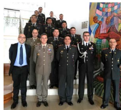
Quito, la delegación IILA - C-IED

entes pasos del proyecto consistentes en el «Mine Clearance Course – Demining training activity» (Roma, 18 de noviembre - 2 de diciembre de 2019) y en la donación de detectores de metales al Cuerpo de Ingenieros del Ejército ecuatoriano.