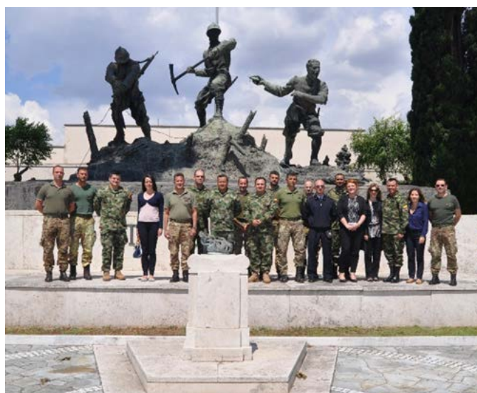
Foto de grupo IILA, Centro de Excelencia C-IED, delegación de Fuerzas Armadas colombianas

La misión, que se centró en definir los últimos detalles de las actividades de formación que se ofrecerán en las fases posteriores del proyecto, brindó al experto colombiano la oportunidad de participar en la Reunión Anual de la Agencia Europea de Defensa (AED) celebrada en Roma los días 10 y 11 de noviembre de 2015, en la que pudo ilustrar las actividades llevadas a cabo por su grupo y las principales cuestiones relacionadas con las actividades de desminado antipersonal.