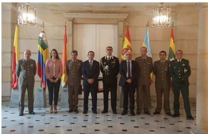
Bogotá, Palacio Presidencial. La delegación IILA - C-IED durante la visita en la Casa de Nariño

La delegación informó a las autoridades militares colombianas de los resultados de la actividad de formación de abril de 2017 y recogió nuevas solicitudes de formación. Durante una reunión con el Jefe del Estado Mayor del Ejército de Colombia, se expusieron los ambiciosos objetivos de transformación del Ejército colombiano con vistas a superar la fase de emergencia y su despliegue gradual y creciente en escenarios internacionales.