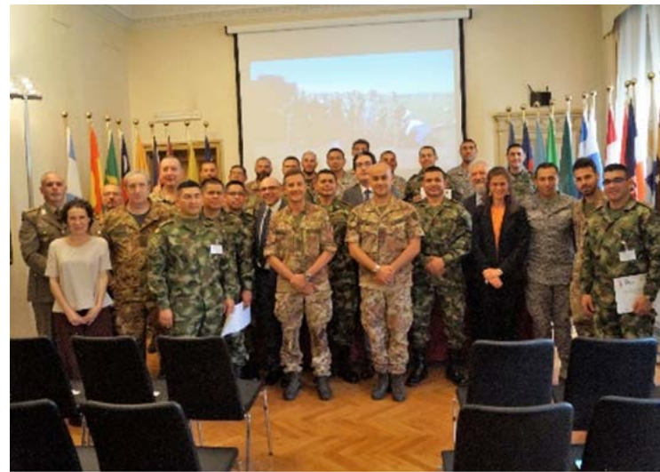
Ceremonia de entrega de los certificados en la IILA

Los artefactos explosivos sin estallar de gran calibre y fabricación industrial siguen representando una de las amenazas más insidiosas para la seguridad de la población civil y el personal militar. El objetivo del curso era precisamente transferir a los participantes los conocimientos básicos relacionados con las técnicas y procedimientos de aseguramiento de estos artefactos explosivos convencionales utilizados, en particular, por las fuerzas armadas colombianas durante los años del conflicto.