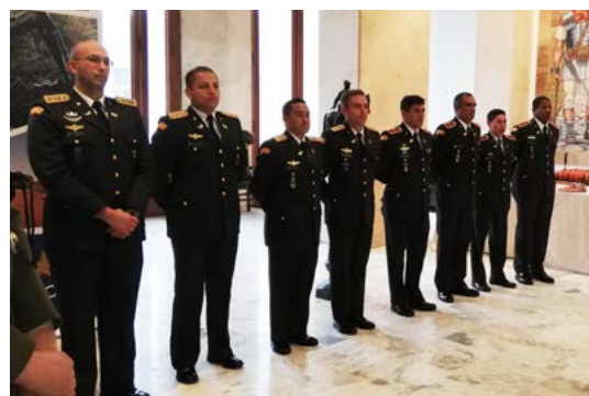
Roma, ISCAG, Ceremonia de entrega de los certificados

El curso proporcionó a los participantes los conocimientos técnicos y las aptitudes básicas para llevar a cabo la búsqueda, detección y limpieza (desminado) de rutas y zonas caracterizadas por la presencia de minas, munición reglamentaria sin detonar (MUSE) o artefactos explosivos improvisados mediante técnicas y procedimientos de desminado.