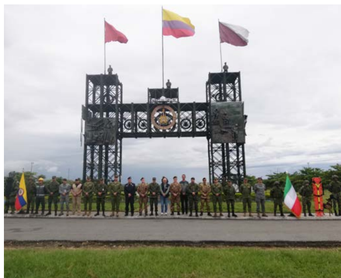
Tolemaida, Fuerte militar

Los cursos fueron impartidos por cinco instructores del Centro de Excelencia Counter - IED.