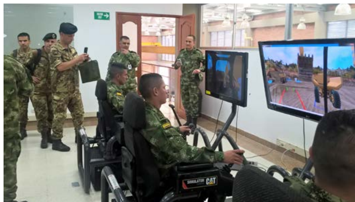
Fuerte militar de Tolemaida, Visita de la delegación IILA - C-IED

Uno de los momentos más significativos de la actividad fue la reunión con el Comandante en Jefe de las Fuerzas Armadas de Colombia, quien ilustró los principales problemas de las Fuerzas Armadas colombianas y las perspectivas de reforma con respecto a las necesidades de unas Fuerzas Armadas cada vez menos comprometidas con el frente interno y más centradas en la cooperación internacional.