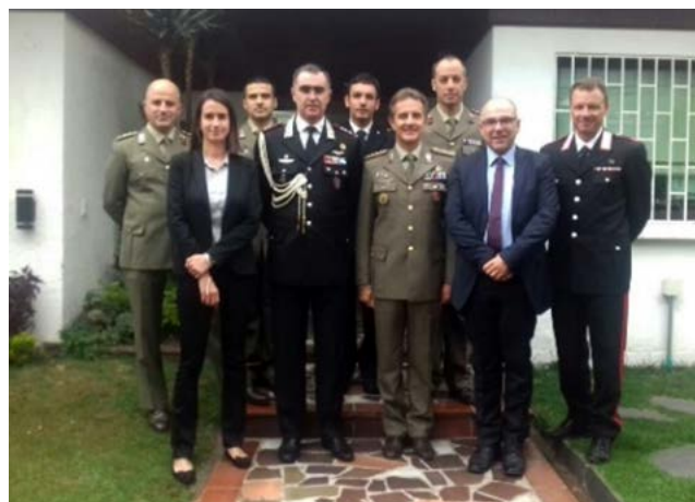
Visita de una delegación IILA - C-IED a la Oficina del Agregado de Defensa italiano