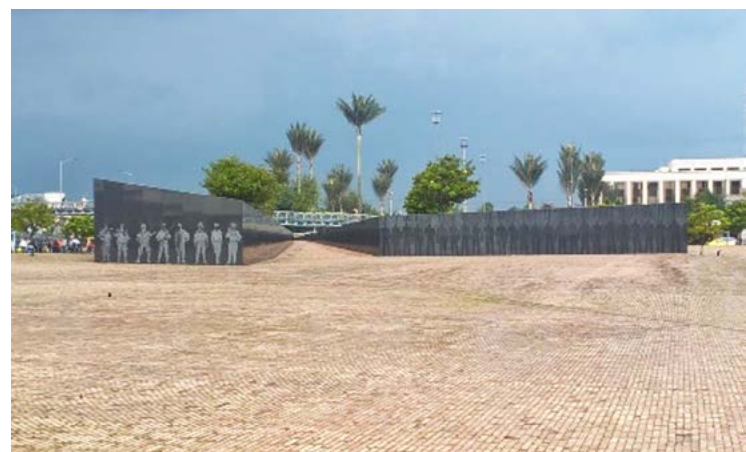
Bogotá, Monumento a las Víctimas del Terrorismo

La misión prestó apoyo técnico al Centro Internacional de Desminado Humanitario - CIDES del Ejército Nacional. Además, se incluyeron a expertos en artefactos explosivos improvisados entre los instructores de los cursos sobre técnicas, tácticas y procedimientos de desactivación de artefactos explosivos según los parámetros de la OTAN, manejo de munición de alto calibre y artefactos sin detonar.