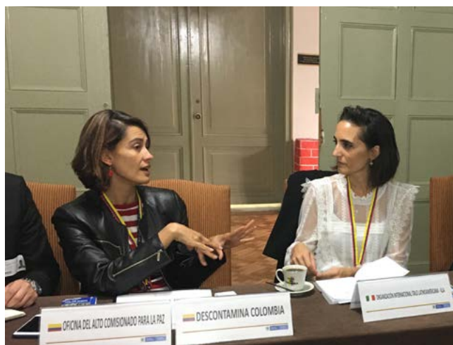
Bogotá, Delegación de la IILA de visita en la OACP