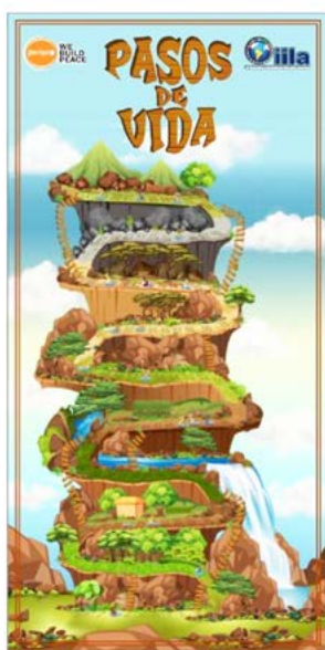
Campaña ERM Pasos de vida

Se trata de aparatos de búsqueda por inducción electromagnética DS-MD utilizados actualmente por el Ejército italiano, fabricados por la empresa CEIA SpA, cuya eficacia ha sido probada en diversos escenarios de crisis internacionales.