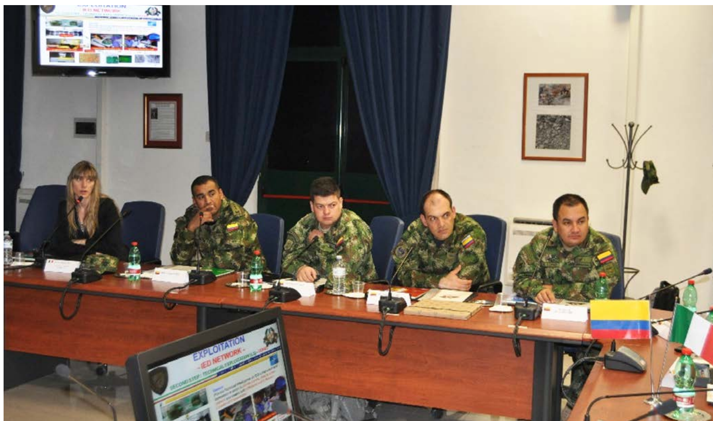
Delegación de Fuerzas Armadas colombianas durante su visita a Italia

Las reuniones con representantes del Centro de Excelencia Counter - IED del Ejército italiano y con varias empresas italianas del ámbito del desminado permitieron brindar a la delegación colombiana una visión general de la experiencia y los conocimientos italianos en el sector y fueron también una oportunidad para intensificar el intercambio de conocimientos con el fin de iniciar la coordinación para la misión de asistencia técnica operativa de la delegación IILA - C-IED a Colombia en septiembre de 2014.