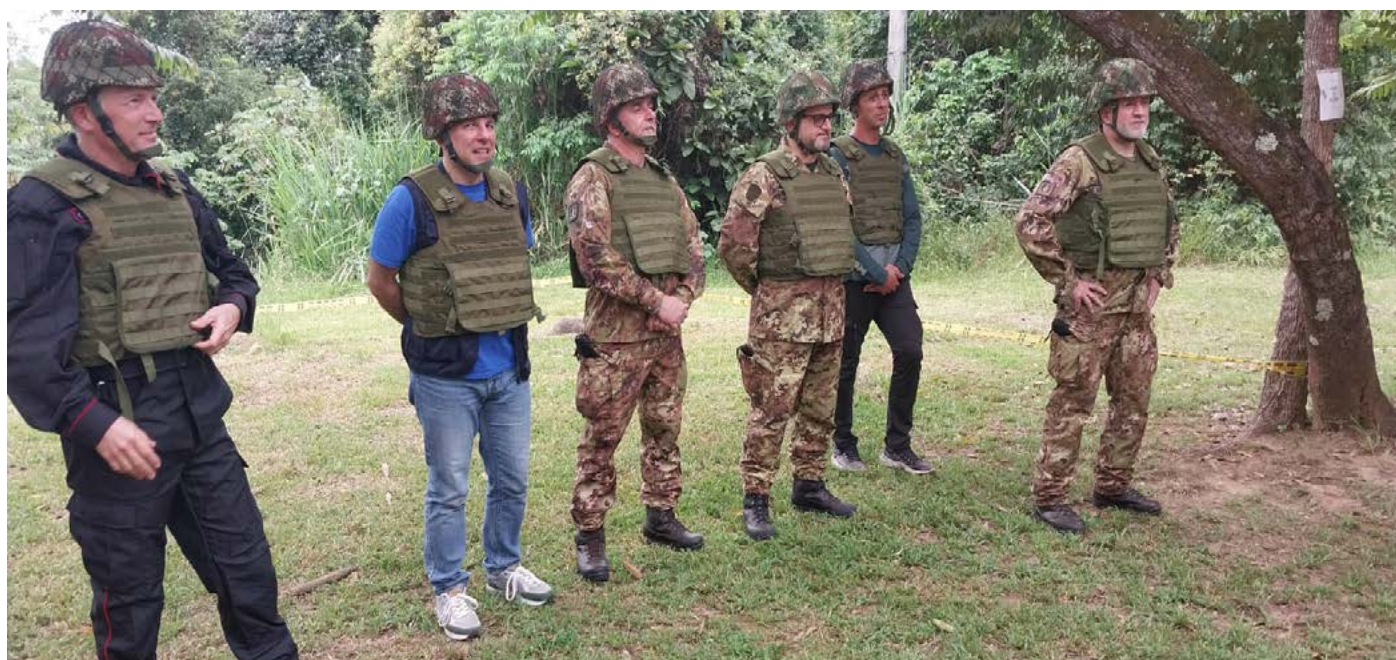
Base militar de Tolemaida, visita de la delegación IILA - C-IED

Además, con el Ministerio de Salud y Protección Social de Colombia, se establecieron directrices para actividades en el campo de la rehabilitación de víctimas de accidentes de minas en las que se espera que participe el hospital pediátrico OPBG.