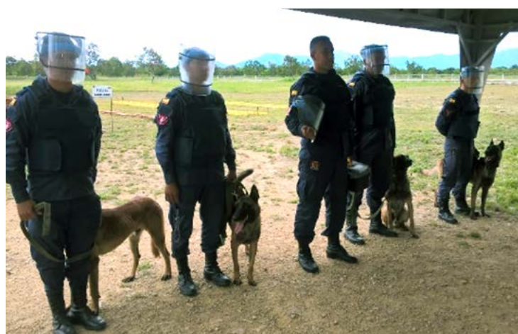
Fuerte Militar de Tolemaida - unidad de desminado canino

La actividad, organizada con ocasión de la ceremonia de cierre de los cursos «Field Exploitation» y «Attack the Network», que coincidió con la entrega al Centro Nacional Contra Artefactos Explosivos y Minas - CENAM del primer lote de equipos técnicos donados por la IILA, se dedicó a planificar las futuras actividades del proyecto durante reuniones con el Agregado de Defensa italiano y las autoridades colombianas.