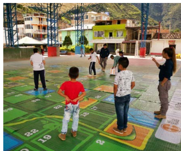
Campaña ERM "Juega seguro"