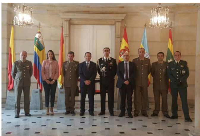
Bogotá, Palazzo presidenziale. La delegazione IIA - C-IED in visita alla Casa di Nariño

La delegazione ha illustrato alle autorità militari colombiane i risultati dell'attività addestrativa del mese di aprile 2017 e raccolto ulteriori richieste di formazione. Nel corso di un incontro con il Capo di Stato Maggiore dell'Esercito Colombiano, sono stati illustrati gli ambiziosi obiettivi di trasformazione dell'Esercito Colombiano in vista del superamento della fase di emergenza e di un suo progressivo, maggiore impiego in ambiti internazionali.