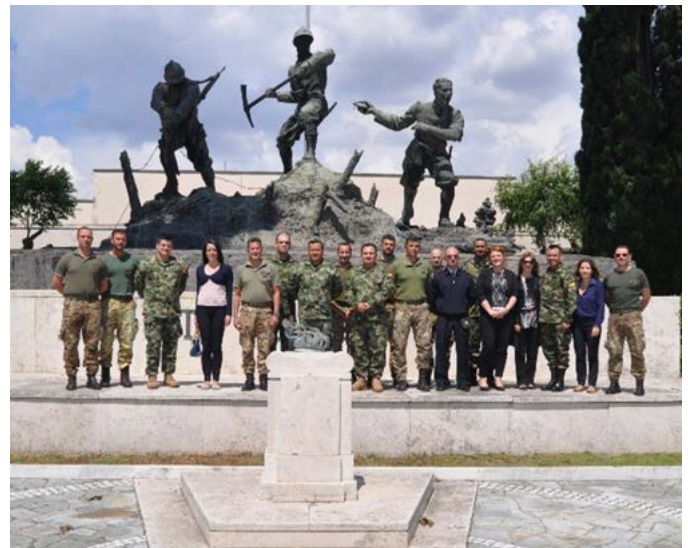
Foto di gruppo IIIA, Centro d'Eccellenza C-IED, delegazione delle FFAA colombiane

La missione, che si è concentrata sulla definizione degli ultimi dettagli delle attività di formazione da offrire nelle successive fasi del progetto, ha offerto all'esperto colombiano l'opportunità di partecipare al Meeting annuale dell'Agenzia di Difesa Europea (EDA) svolto a Roma il 10 e l'11 novembre 2015 in occasione del quale ha potuto illustrare le attività svolte dal suo gruppo e le maggiori problematiche legate alle attività di bonifica dalle mine antiuomo.