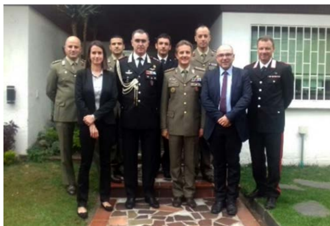
Delegazione IIA - C-IED in visita presso l'Ufficio dell'Addetto alla Difesa d'Italia