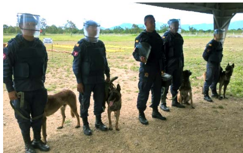
Forte militare di Tolemaida, cani da sminamento

L'attività, organizzata in occasione della cerimonia di chiusura dei corsi Field Exploitation e Attack the Network coincide con la consegna al Centro Nazionale Contro gli Artefatti Esplosivi e Mine – CENAM della prima quota delle attrezzature tecniche donate dall'IILA, è stata dedicata a pianificare le future attività del progetto nel corso di riunioni con l'Addetto alla Difesa d'Italia e con le autorità colombiane.