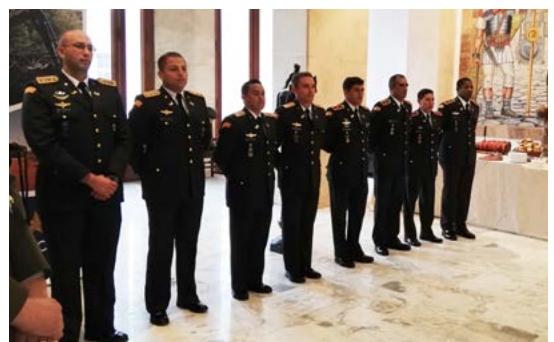
Roma, ISCAG, Cerimonia consegna diplomi

Il corso ha fornito ai partecipanti le conoscenze tecniche di base e le competenze per condurre attività di ricerca, individuazione e bonifica ( mine clearance ) di itinerari e aree caratterizzate dalla presenza di mine, di munizionamento regolamentare inesplosivo (UXOs) o di ordigni esplosivi improvvisati mediante tecniche di bonifica e procedure di messa in sicurezza.