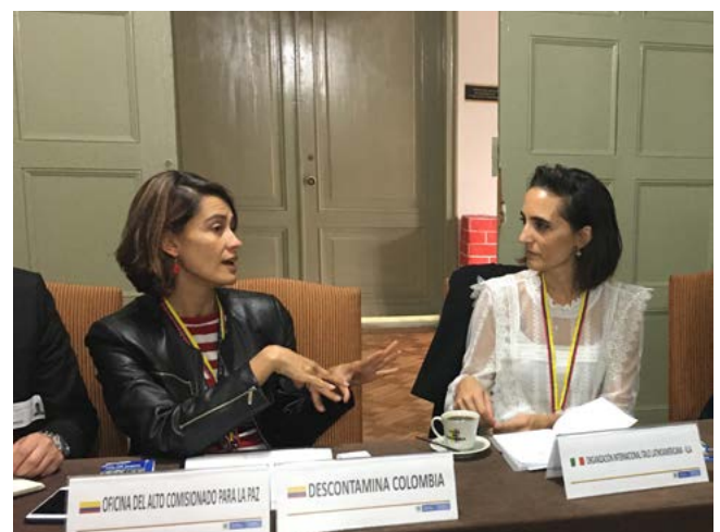
Bogotá, Delegazione IILA in visita alla OACP