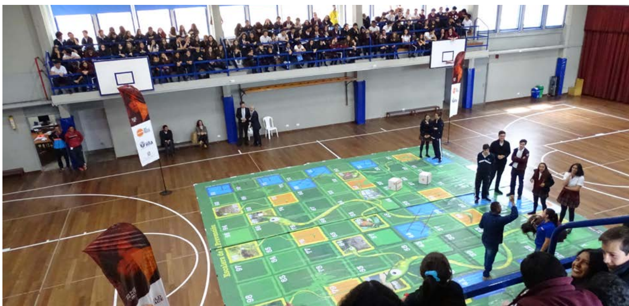
Campagna ERM Cuidando mis pasos con comportamientos seguros