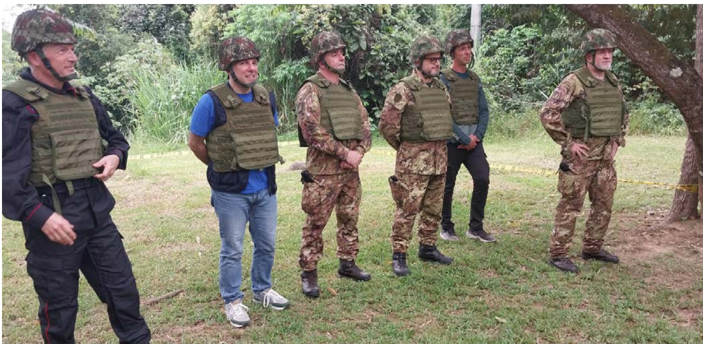
Base militare di Tolemaida, visita della Delegazione IIA - C-IED

Con il Ministero della Salute e della Protezione Sociale della Colombia, inoltre, sono state stabilite alcune linee guida relative ad attività nel campo del recupero delle vittime degli incidenti da mine in cui è prevista la partecipazione dell'Ospedale Pediatrico Bambino Gesù.