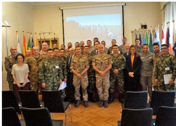
Cerimonia di consegna dei diplomi all'IILA

Il corso si è appunto proposto di trasferire ai partecipanti le competenze basilari relative alle tecniche e alle procedure di messa in sicurezza di tali ordigni esplosivi convenzionali utilizzati in particolare dalle forze armate colombiane negli anni del conflitto.