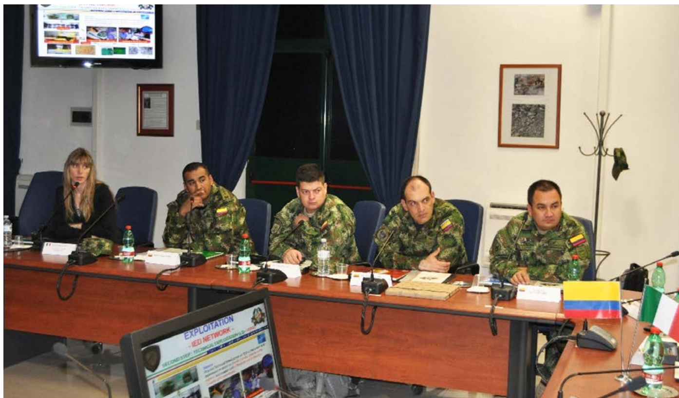
La delegazione delle FFAA colombiane in visita in Italia

Gli incontri con i rappresentanti del Centro di Eccellenza Counter-IED dell'Esercito italiano e con alcune aziende italiane nel campo dello sminamento hanno offerto alla delegazione colombiana un quadro generale dell'esperienza e delle competenze italiane nel settore e sono stati anche un'occasione per intensificare lo scambio di conoscenze al fine di avviare il coordinamento per la missione operativa di assistenza tecnica della delegazione ILLA - C-IED in Colombia del mese di settembre 2014.