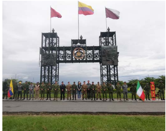
Tolemaida, Forte militare

Il Corso Field Exploitation di 1° livello (15-26 febbraio 2016) ha fornito competenze per riconoscere un ordigno esplosivo e risalire ai dati biometrici da utilizzare come elementi probatori nelle successive fasi processuali a carico dei responsabili di atti ostili. Il corso Attack the Network (29-11 marzo 2016) ha avuto per oggetto la pianificazione e la conduzione di attività di ricerca dei responsabili di atti ostili. I corsi sono stati impartiti da 5 istruttori del Centro d'Eccellenza Counter – IED.