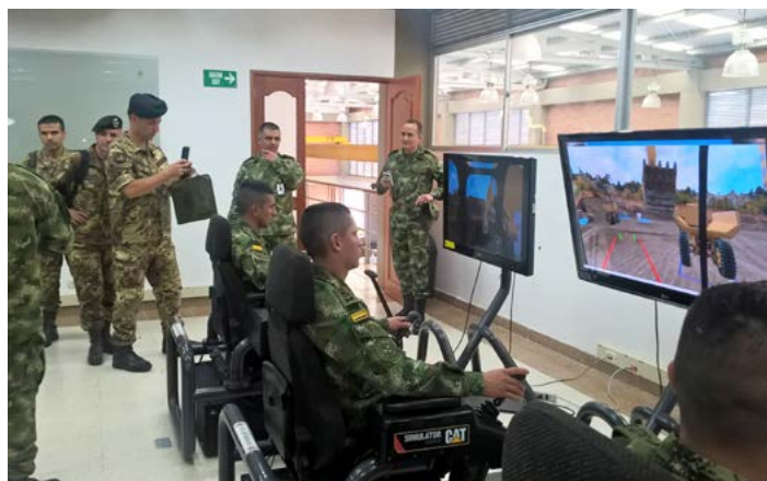
Forte militare di Tolemaida, Visita della delegazione IILA - C-IED

Tra i momenti più significativi dell'attività, l'incontro con il Comandante in capo delle Forze Armate Colombiane che ha illustrato le maggiori problematiche delle Forze Armate colombiane e le prospettive di riforma rispetto alle esigenze di una forza armata sempre meno impegnata sul fronte interno, più proiettata alla cooperazione internazionale.