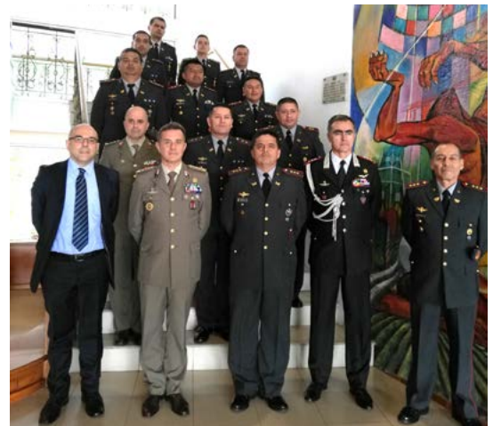
Quito, la delegazione IILA - C-IED

La missione ha fornito elementi utili a inquadrare le problematiche legate alla presenza sul territorio ecuadoriano di artefatti esplosivi e di mine antiuomo artigianali e di fabbricazione industriale. I colloqui con le autorità militari ecuadoriane sono stati utili a definire altri aspetti inerenti le successive tappe del progetto consistente nel corso di formazione Mine Clearance Course - Demining training activity (Roma, 18 novembre - 2 dicembre 2019) e nella donazione di metal detector a favore del Corpo degli Ingegneri dell'Esercito dell'Ecuador.