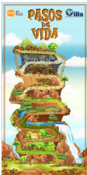
Campagna ERM Pasos de vida

Si tratta di apparati di ricerca a induzione elettromagnetica DS-MD attualmente in dotazione all'Esercito Italiano, prodotto dalla ditta CEIAS.p.A. la cui efficacia è stata testata su diversi scenari di crisi internazionali.