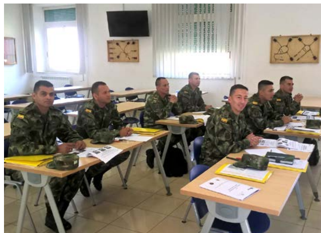
Gruppo dei militari colombiani partecipanti al corso

Partecipanti: 8 esperti delle Forze Armate colombiane, selezionati tra i corsisti dell'addestramento Train the Trainer: Field Exploitation e Train the Trainer: Attack the Network , tenutisi in Colombia nel quadro della prima fase del Progetto. Il corso mira a formare personale qualificato in possesso di un livello base nell'ambito della raccolta di materiale probatorio ( Evidence Collection - Rilevamento e Raccolta non contaminata).