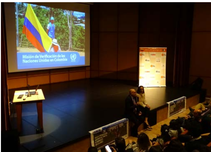
Bogotá, Liceo italiano Leonardo da Vinci. La delegazione IILA intervenuta alla chiusura della campagna ERM Gioca sicuro

La delegazione IILA ha inoltre partecipato alla cerimonia di chiusura della campagna "Gioca sicuro" tenutasi presso il liceo italiano Leonardo Da Vinci alla presenza dell'Ambasciatore d'Italia in Colombia. Nel corso della cerimonia è stato illustrato il progetto "Sostegno al Governo Colombiano per il rafforzamento dell'AICMA" agli studenti del liceo.