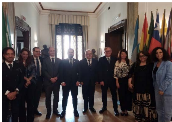
20 giugno 2024 foto di gruppo: delegazione guatemalteca, rappresentanti dell'ANAC, Vice direttore de EL PACCTO 2.0, Responsabile dei progetti europei per IILA.