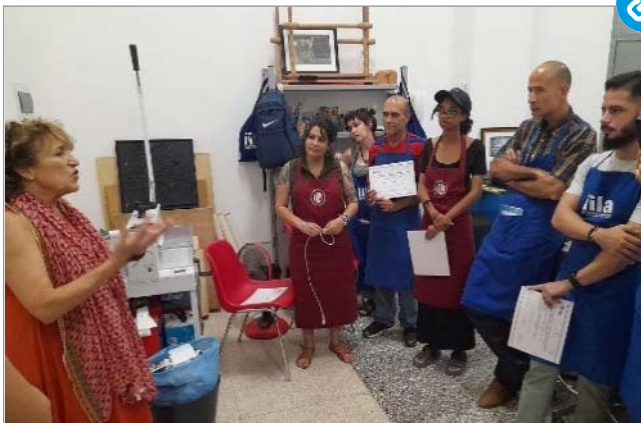
Si è concluso all'Avana il Corso "Conservazione della rilegatura storica e rilegatura contemporanea e creativa"