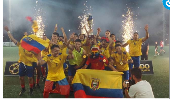
L'Ecuador vince per il 2° anno consecutivo il "Mundialido", torneo internazionale di calcio