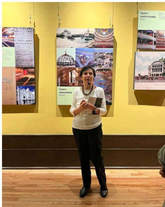
Muestra "Vissi d'Arte. Presencia italiana en los teatros de América Latina", Museo Nacional de Arquitectura, Palacio de Bellas Artes, Ciudad de México, 30 de mayo – 11 de agosto de 2024.

La tappa successiva della mostra sarà Rio de Janeiro.