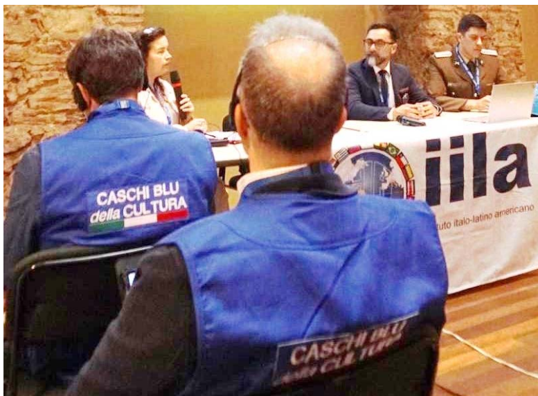
I Caschi Blu della Cultura del MiC – Ministero della Cultura.

El curso pretende compartir con los 4 países beneficiarios (Brasil, Chile, Colombia y Paraguay) experiencias y buenas prácticas para la posible creación de "Casco Azul para la Cultura".