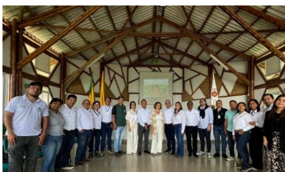
Visita al Centro Agropecuario del SENA