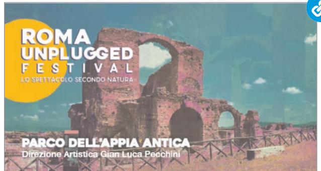
IILA concede il suo patrocinio al festival Roma Unplugged