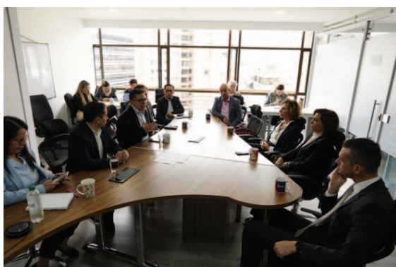
Firma dell'Accordo IILA-RAP-E (Región Administrativa y de Planificación Especial).

En el proyecto Paz Colombia, ejecutado por la IILA y subvencionado por la DGCD/MAECI, participaron más de 10.000 colombianos.