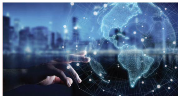
Las redes de cooperación penitenciaria