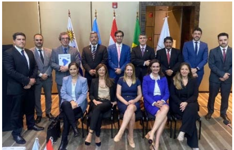
Foto ufficiale della XVII Riunione del SGTN18, Asunción – 13 giugno 2024.

I referenti EUROFRONT hanno partecipato anche alla XVII Riunione del Sottogruppo di Lavoro N18 sull'Integrazione delle Frontiere nel corso della quale, oltre agli studi precedentemente menzionati, hanno presentato un distinto lavoro sull'implementazione dell'Accordo sulle "Localidades Fronterizas Vinculadas" (ALFV), primo passo verso una libera circolazione nelle zone di frontiera dei paesi del MERCOSUR.