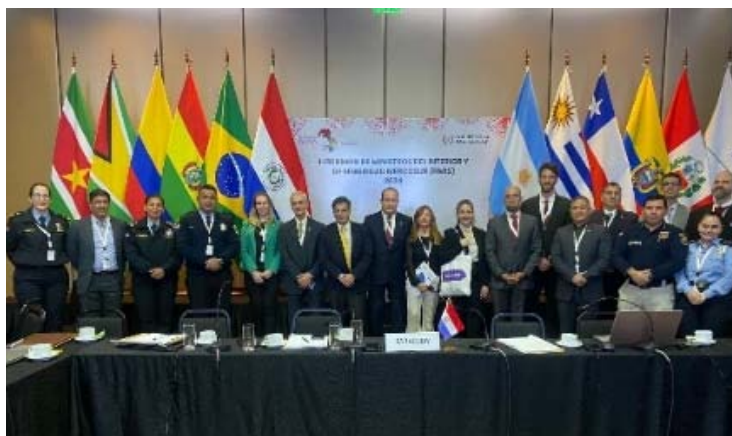
Infosesi n EUROFRONT, Bruxelles – 19 giugno 2024.