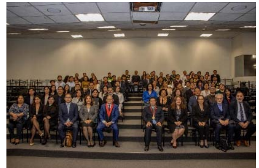
Foto di gruppo.