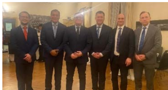
20 febbraio l'IILA accoglie la delegazione del Paraguay.

Nell'ambito del nutrito programma di lavori che ha condotto i delegati di Asunción alla DIA, alla DCSA e a riunioni con tutte le forze di polizia, particolare rilievo ha assunto la riunione di coordinamento operativo tenuta nella DNA con i Magistrati dell'Ufficio nazionale di impulso e coordinamento delle attività giudiziarie antimafia.