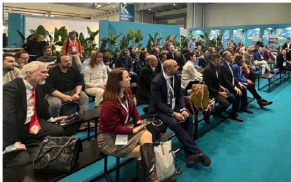
Evento presso l'Hydrogen Arena della fiera Key.

Del 26 di febbraio al 1 di marzo, la IILA promoviò una serie di attività dedicate a la cooperación internacional en el ámbito del hidrógeno verde, realizadas en el marco del Proyecto IILA "Economía Circular y Ciudades Verdes" financiado por la DGCS-MAECI, dedicado a funcionarios del sector público y operadores del sector privado de los países miembros de la Organización. Durante la primera jornada tuvo lugar en la sede de la IILA un encuentro de intercambio y networking para explorar las remarcables potencialidades de cooperación entre Italia y América Latina en el sector del hidrógeno verde y, en general, de las energías renovables. El evento fue inaugurado por la Secretario General de la IILA, Antonella Cavallari , el Director General de Promoción de Sistema País de MAECI, Mauro Battocchi y el Viceministro de Industria, Energía y Minería de Uruguay, Walter Verri . Intervinieron como ponentes Alberto de Paoli, Director Rest of the World de ENEL, Giorgio Graditi, Director General de ENEA, Marco Ravazzolo, Director Políticas Medioambientales, Energéticas y de Movilidad de Confindustria y Lidia Armelao, Director del Departamento Ciencias Químicas y Tecnologías de Materiales del CNR .