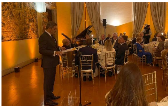
S.E. Renato Mosca de Souza, Ambasciatore del Brasile in Italia apre la cerimonia in occasione dei 150 anni della Grande Migrazione italiana in Brasile.

Leggi l'articolo completo nella sezione "Cooperazione scientifica" | Más información en el apartado "Cooperación científica"