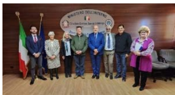
La delegazione del Paraguay in visita presso la DCSA.

En el marco del intenso programa de trabajo que llevó a los delegados de Asunción en la DIA, DCSA y reuniones con todos los Cuerpos Policiales, tuvo especial relevancia la reunión de coordinación operativa realizada en la DNA con los Magistrados de la Oficina Nacional para el impulso y coordinación de las actividades judiciales antimafia.