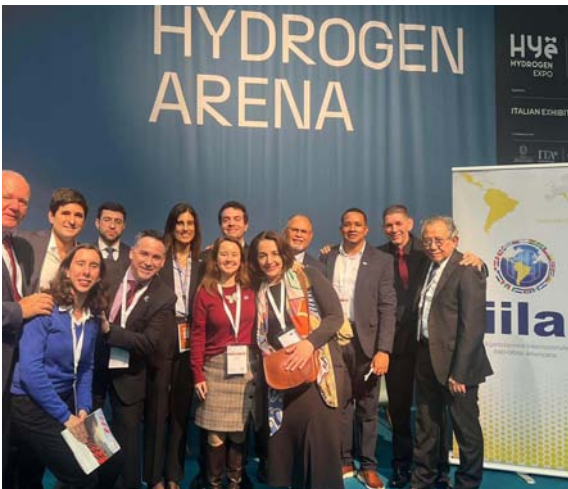
Delegazione presso la fiera Key di Rimini.