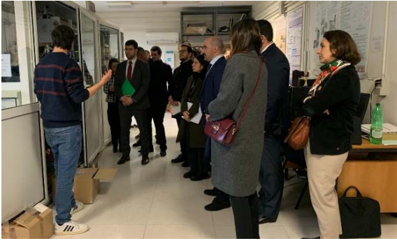
Visita della delegazione presso il Centro Ricerche ENEA Casaccia.