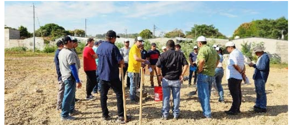
Corso in orticoltura sostenibile del Centro di Innovazione Agricola SISTAGRO a Metapán El Salvador.

È stato dato avvio al progetto di cooperazione internazionale "Innovazione tecnologica e ricerca scientifica per un'orticoltura sostenibile e competitiva nella regione Trifinio".