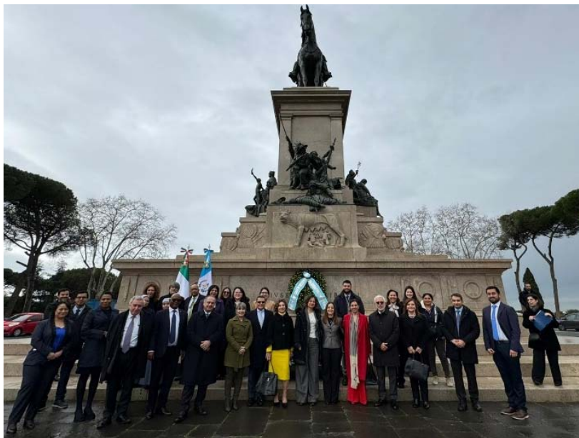
160° Anniversario delle Relazioni diplomatiche tra Guatemala e Italia.

29 febbraio – IILA ha partecipato alla commemorazione in occasione del 160° Anniversario delle Relazioni diplomatiche tra Guatemala e Italia. Orgogliosi del riconoscimento da parte dei rappresentanti di entrambi i Governi del ruolo di questa Organizzazione nel rafforzamento delle relazioni con questo Paese membro! ■