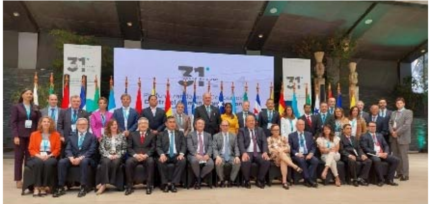
1 e 2 febbraio foto di gruppo AOAMP Santiago del Cile.

Además, se compartieron los resultados de la asistencia técnica realizada en 2023 en colaboración con tres de las redes de fiscales activadas por la AIAMP: la Red Iberoamericana de Fiscales Antidrogas, la Red Iberoamericana de Fiscales Especializados contra la Trata de Personas y Tráfico Ilícito de Migrantes y la Red especializada en Temas de Género.