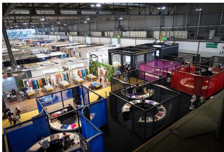
Fiera LINEAPELLE 2024