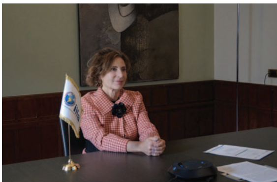
SG Cavallari interviene alla cerimonia di chiusura del progetto STEM in Centro America.

19 de febrero – La Secretaria Cavallari se reúne con el Presidente de la Agencia Espacial Italiana, Teodoro Valente . En el encuentro, la SG ilustró las numerosas actividades de la IILA en el sector de la cooperación espacial de cara al III Encuentro de Agencias Espaciales latinoamericanas que la IILA organiza en colaboración con las autoridades chilenas y que se celebrará en abril en Santiago de Chile.