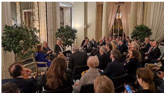
SG Cavallari interviene al dialogo organizzato dalla Fondazione Euroamérica presso l'Ambasciata d'Italia a Madrid.

2 febbraio – La Segretario Generale dell'IILA, Antonella Cavallari, è intervenuta al dialogo organizzato dalla Fondazione Euroamérica presso l'Ambasciata d'Italia a Madrid per approfondire l'analisi della situazione regionale e dei rapporti UE America Latina dalla prospettiva delle relazioni di Italia e Spagna con la Regione. L'evento, moderato dal Presidente della Fondazione Euroamérica, Ramón Jáuregu , è stato aperto dagli interventi dell'Ambasciatore d'Italia in Spagna, Giuseppe Buccino Grimaldi e della Segretario Generale Cavallari ed è stato successivamente animato dal dibattito con l'ampia e qualificata platea.