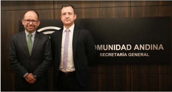
Foto ufficiale presso la Secretaría General della Comunità andina.

Durante la riunione sul dispositivo di integrazione regionale maggiormente coinvolto nelle attività di armonizzazione normativa organizzate da EUROFRONT, è stato possibile tracciare una strategia comune per l'implementazione del "Plan de Acción Resolutivo de los países de la Comunidad Andina sobre la delincuencia organizada transnacional".