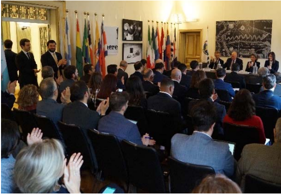
Apertura dei lavori dell'evento "Cooperazione Internazionale nel settore dell'idrogeno verde: opportunità commerciali e di sviluppo tra Italia e America Latina".