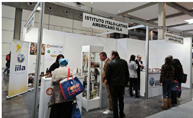
Stand istituzionale IILA nella Beer&Food Attraction.

L'IILA, in collaborazione con ProEcuador, ha organizzato un evento di degustazione di prodotti tipici dell'Ecuador: un cocktail a base di canna da zucchero manabita e chips di platano, che sono stati offerti ai visitatori della Fiera.