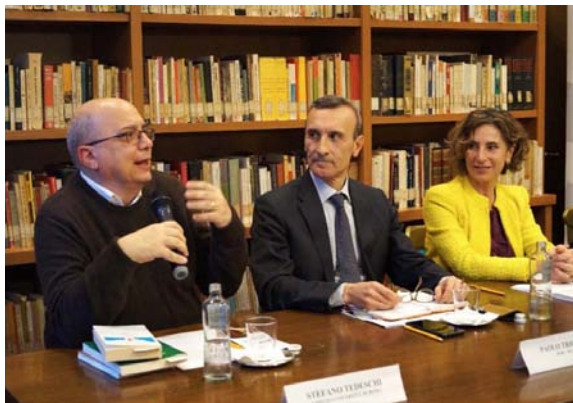
L'incontro in biblioteca del 13 febbraio

Presentazione del libro "Diplomazia e letteratura - gli otto diplomatici vincitori del Premio Nobel per la letteratura" di Paolo Trichilo (Ministro Plenipotenziario presso il Ministero degli Esteri).