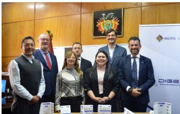
Foto oficial de la Delegación de EUROFRONT con la Dirección General de Migración boliviana.