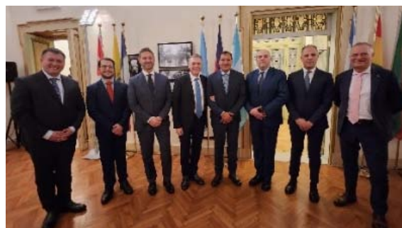
20 febbraio la delegazione del Paraguay con le Forze di polizia italiane