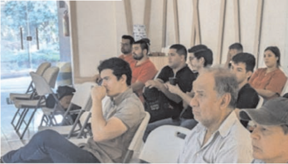
Attività di formazione in Paraguay