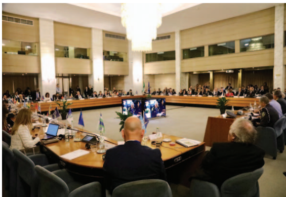
XI Conferenza Italia-America Latina e Caraibi.