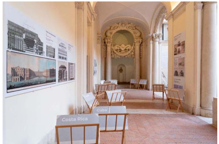
Mostra «Vissi d’Arte. Italia nei teatri dell’America Latina», Accademia Nazionale di San Luca.

La idea fundamental de “Vissi d’arte. Italia nei teatri dell’America Latina” radica en la constatación de que la riqueza de una ciudad no radica únicamente en monumentos y obras aisladas, sino en el sistema de relaciones espaciales y temporales que se establece entre ellos a través de un proceso continuo de fruición y transformación.