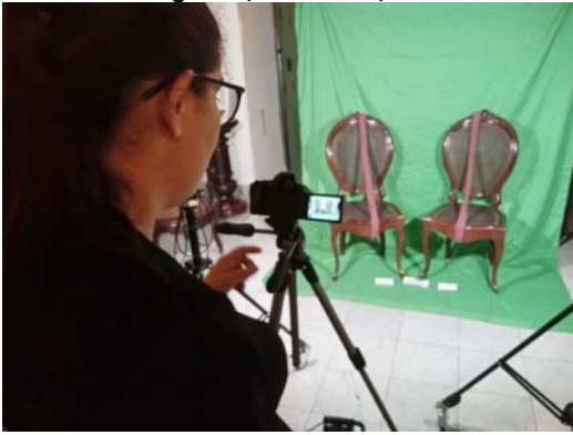
Studio fotografico allestito con attrezzature donate da IILA.

Los participantes – 19 funcionarios de la Dirección de Patrimonio-Subdirección Patrimonio Museal /OHCH y de la Casa Leal, de entre museólogos y archivistas – dieron lugar a un vibrante intercambio de conocimientos, que destacó la importancia del trabajo realizado en la intención común de preservar el patrimonio ciudadano, y cubano en general.