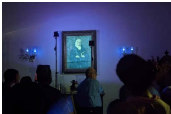
Tecnica Fluorescenza UV per mostrare lo stato di conservazione ed interventi di restauro sulle opere di pittura.