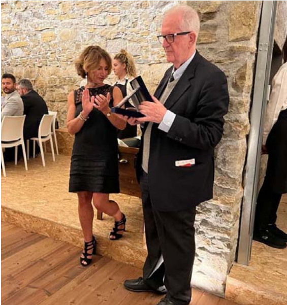
Cena di gala del VII Foro PyMES dove è stata consegnata la targa al Senatore Gilberto Bonalumi, in riconoscimento dell'impegno e dedizione profusi in una vita per l'America Latina.

A conclusione della sessione inaugurale, il Sottosegretario Silli è stato testimone d'onore della firma dell'Accordo tra la Segretario Generale dell'IILA Antonella Cavallari e il Segretario Generale della SEGIB Andrés Allamand . Tale accordo – che si inserisce perfettamente in un momento di forte rilancio delle relazioni tra Europa e America Latina che vede lavorare sinergicamente Italia, Spagna e Portogallo – permetterà alle due istituzioni di rafforzare la cooperazione già in atto su tematiche di comune interesse, tra cui appunto il sostegno alle PMI, il rafforzamento della collaborazione accademica e dell'industria culturale, la promozione dell'uguaglianza di genere e della coesione sociale.