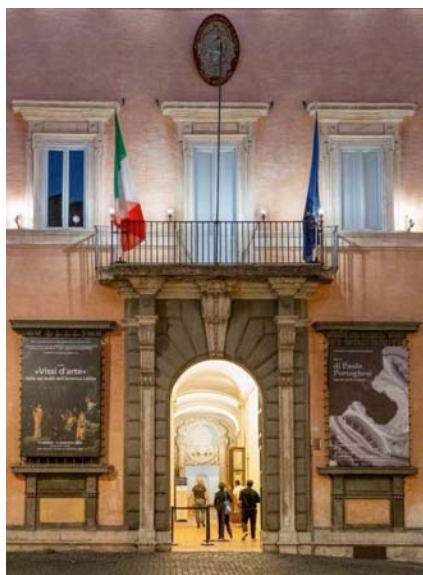
Mostra «Vissi d'Arte. Italia nei teatri dell'America Latina», Accademia Nazionale di San Luca.

L'idea fondamentale di "Vissi d'arte. Italia nei teatri dell'America Latina" risiede nella constatazione che la ricchezza di una città non si radica solo in monumenti ed opere isolate, ma nel sistema di relazioni spaziali e temporali, che si sono instaurate tra di loro attraverso un continuo processo di fruizione e trasformazione.