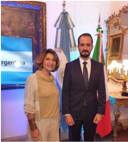
Antonella Cavallari, Segretario Generale IILA e S.E. Roberto Carlés, Ambasciatore dell'Argentina in Italia

30 ottobre - La Segretario Generale Cavallari ha partecipato al 40° Aniversario dal ritorno della democrazia in Argentina svoltasi presso l'Ambasciata della Repubblica Argentina in Italia e organizzato dall'Ambasciatore Roberto Carlés.