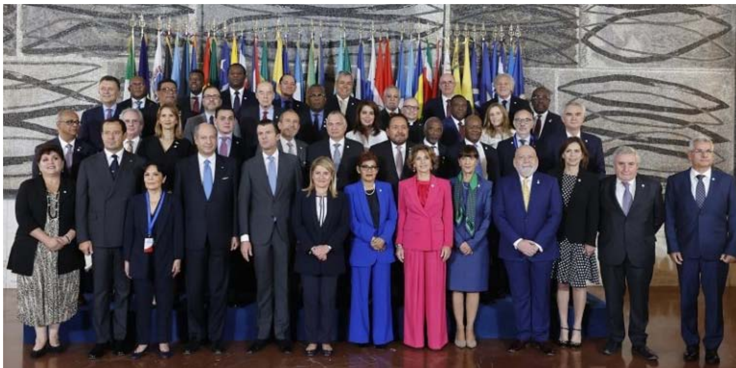
Foto di famiglia della XI Conferenza Italia-America Latina e Caraibi