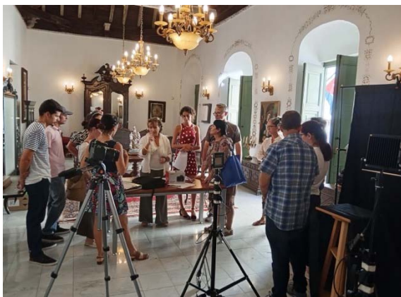
Pratica nella sala principale della Casa Leal.

I partecipanti - 19 funzionari provenienti dalla Dirección del Patrimonio, Subdirección Patrimonio Museal /OHCH e dalla Casa Leal, tra cui museologi e archivisti – hanno dato vita a un vivace interscambio di conoscenze, che ha evidenziato l'importanza del lavoro svolto nell'intento comune di preservare il patrimonio cittadino e cubano in generale.