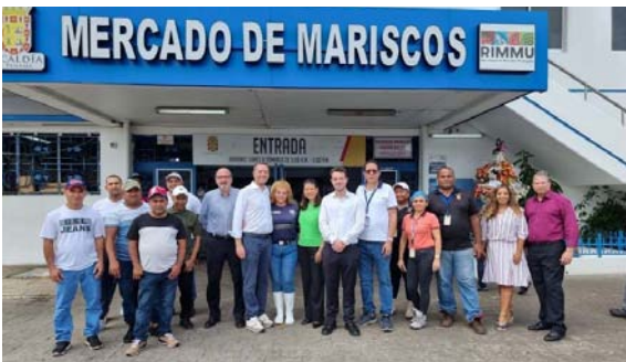
Missione in Panama – Mercato del Pesce.