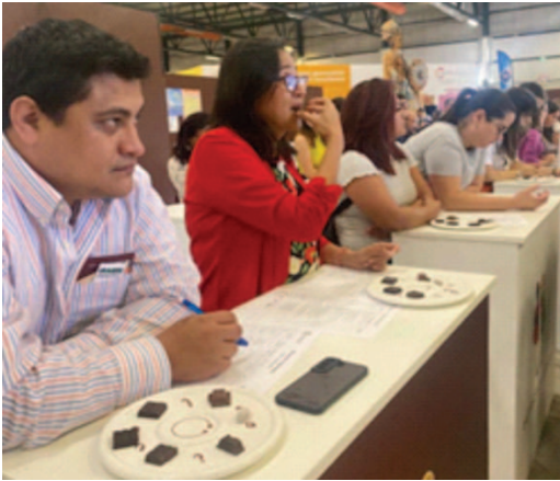
Fiera Eurochocolate, Perugia - Attività di degustazione.