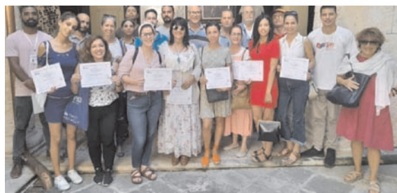
Momento della Cerimonia di consegna dei Diplomi del corso.