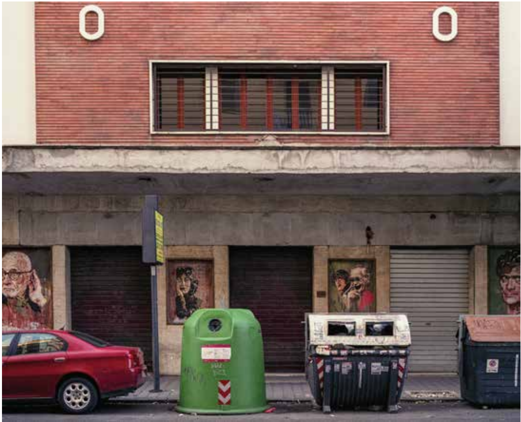
Spazio Impero Via di Acqua Bullicante 121