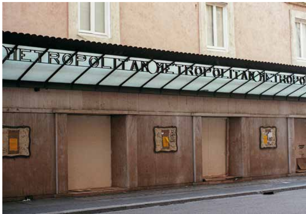
Cinema Metropolitan Via del Corso 7