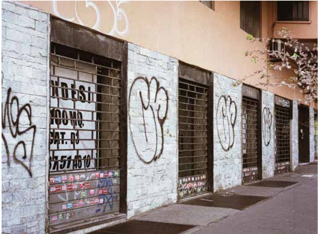
Cinema Ulisse Via Tiburtina 345