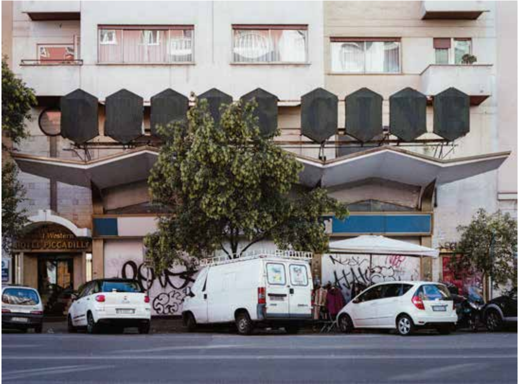
Cinema Paris Via Magna Grecia 112