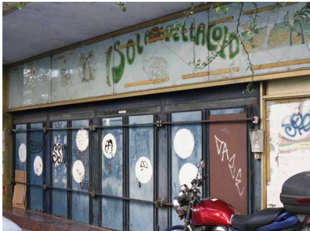
Cinema Airone Via Lidia 44