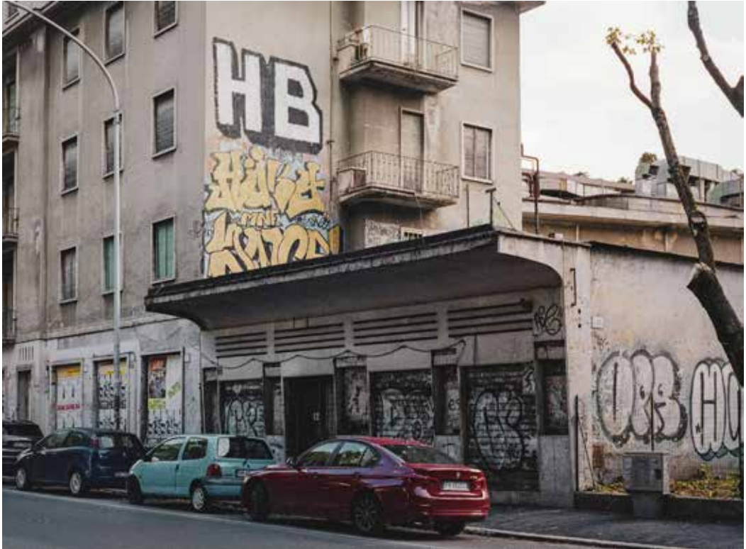
Cinema Jonio - Cinema Astra Viale Jonio 209