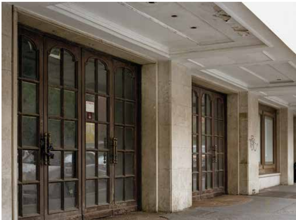
Cinema Embassy Via Stoppani 7