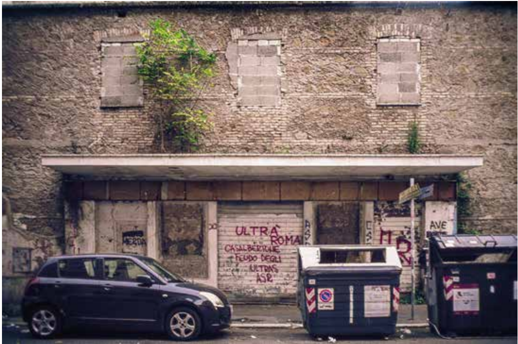
Cinema Puccini Via Baldassarre Orero 32