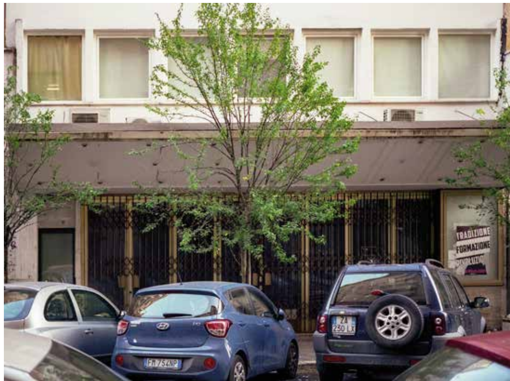
Cinema Africa - Cinema Apollo Via dei Galla e Sidama 16