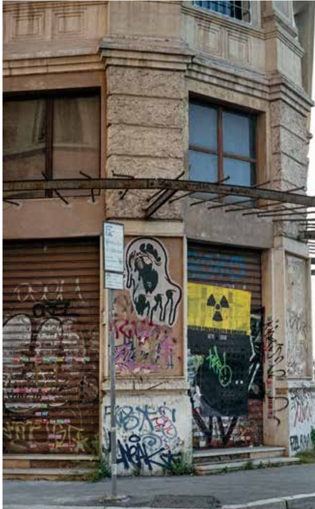
Cinema Apollo Via Cairoli 98