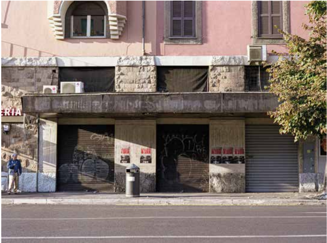
Cinema Aniense Corso Sempione 21