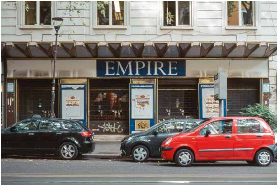
Cinema Empire Viale Regina Margherita 29