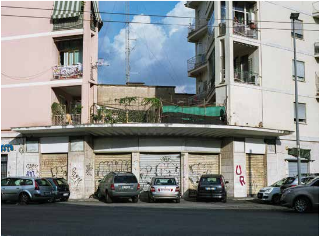
Cinema Aureo Via delle Vigne Nuove 70