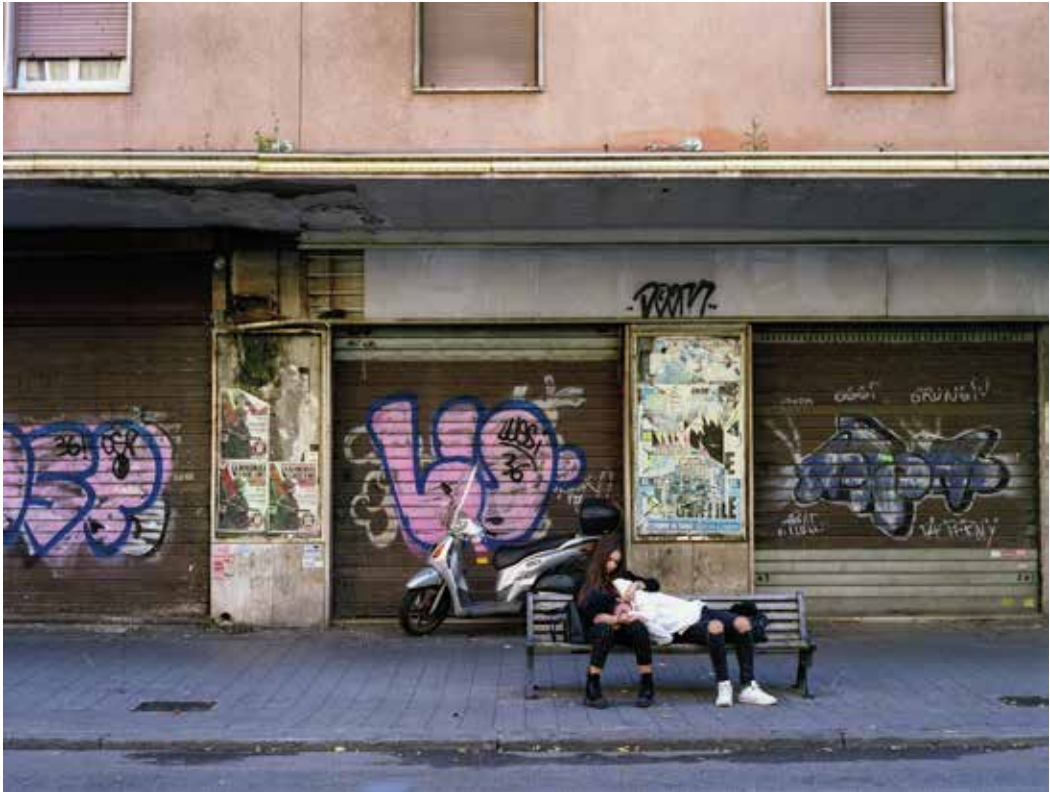
Cinema New york Via delle Cave 36