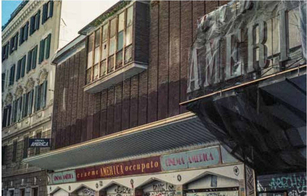
Cinema America Via Natale del Grande 6