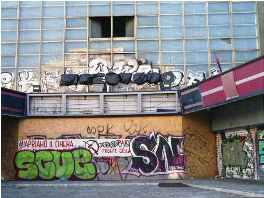
Cinema Maestoso Via Appia Nuova 416