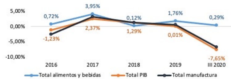
Variación anual PIB Alimentos y Bebidas En porcentajes