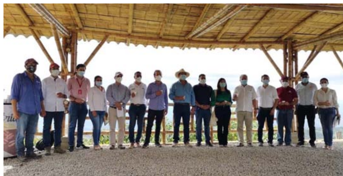
Alleati pubblici e privati della Ruta Magica del Café