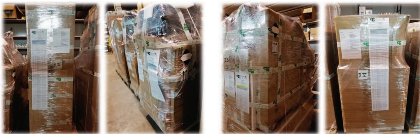
Pallet materiali destinati ai laboratori di restauro e conservazione IILA-OHCH

En el ámbito del Proyecto "Polo Latinoamericano de Conservación del Patrimonio Cultural", y con miras al apoyo a la "Red de Historiadores", a través de la creación y el fortalecimiento de los Talleres IILA-