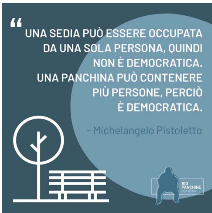
100 panchine per Roma

ILLA patrocina "100 panchine per Roma", proyecto lanzado por Cittadellarte - Fondazione Pistoletto, en el marco del programa Rebirth Forum Roma. Esta iniciativa es de gran interés para ILLA, en cuanto se inspira en los Objetivos de Desarrollo Sostenible de la Agenda 2030 de las Naciones Unidas.