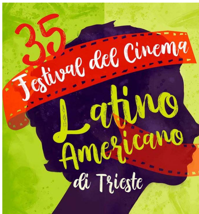
Grafica del XXXV Festival del Cinema Latinoamericano di Trieste