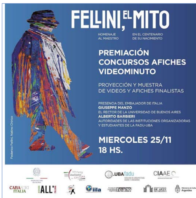
Locandina della premiazione dei concorsi nell'ambito di "Fellini, el mito"

L'ILLA si unisce alla campagna del Segretario Generale delle Nazioni Unite/ UN Women "Pinta el mundo de naranja". Si tratta di una campagna internazionale, con cadenza annuale, che inizia il 25 novembre, Giornata internazionale per l'eliminazione della violenza contro le donne, e termina il 10 dicembre, Giornata dei Diritti Umani.