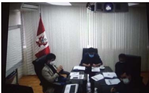
2 settembre 2020 web meeting in materia di misure alternative alla detenzione con le Istituzioni del Perù

El objetivo de la asistencia técnica futura se centrará en la creación de espacios de coordinación interinstitucional y la elaboración de protocolos interinstitucionales, judiciales y penitenziarios para una mejor aplicación de las medidas alternativas a la detención.