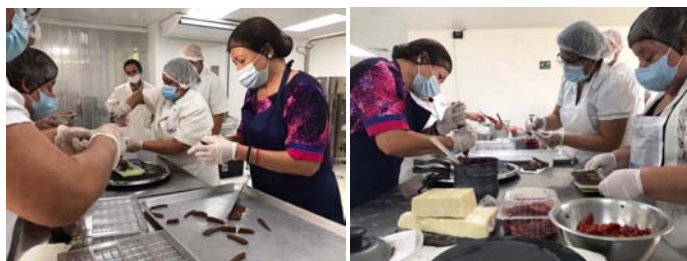
Partecipanti al corso del seminario sulle tecniche di base della produzione di cioccolatini.

gía Agropecuaria y Forestal "Enrique Álvarez Córdova" (CENTA), socio estratégico del proyecto.