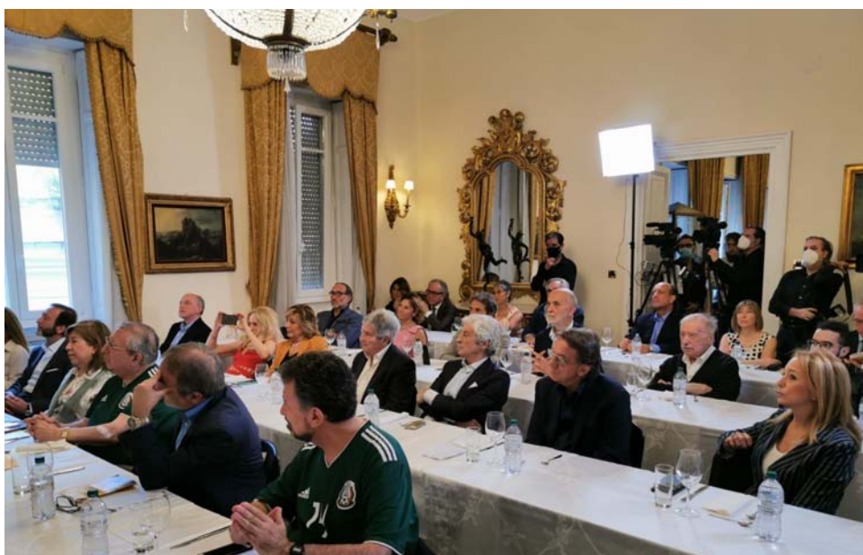
Un momento della cerimonia presso l'Ambasciata del Messico / Un momento del acto en la Embajada de México