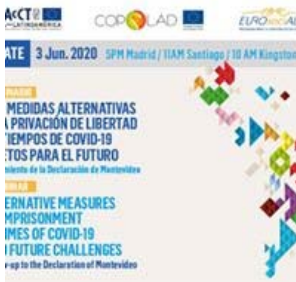
VC 3 giugno 2020

El sector penitenciario contiene las partes más débiles de nuestra sociedad, por lo tanto, es necesario entablar un diálogo permanente y dinámico entre los diferentes actores involucrados en la ejecución