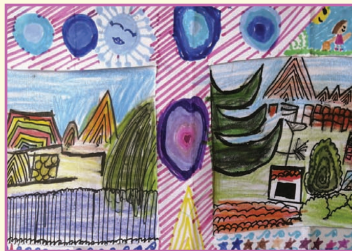
"Así se ve mi colorido hogar" Brunella Pacheco Ampuero (8 anni) - Bolivia

Per sfogliare l'album completo www.facebook.com/culturaliila