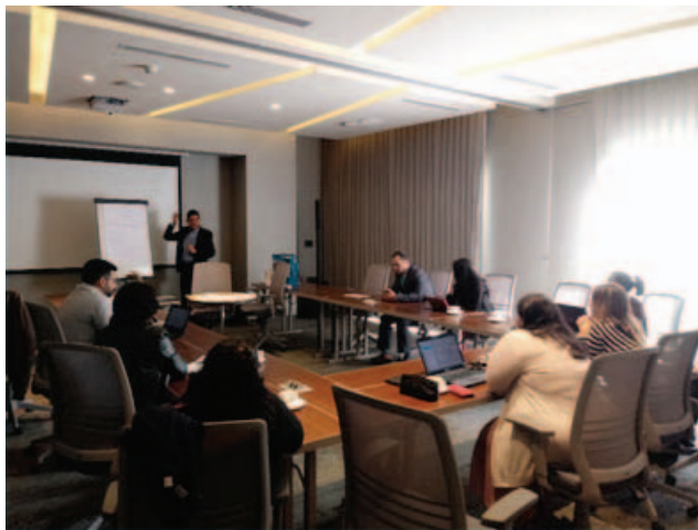
Riunione durante la missione di assistenza tecnica in Guatemala

Lo SNIC ha nella formazione una delle sue componenti primarie e maggiormente strategiche, con l'obiettivo di valorizzare e professionalizzare le mansioni di attenzione e cura attraverso la promozione della capacitazione delle persone che prestano assistenza, in forma remunerata e non remunerata.