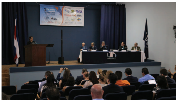
Escuela de Verano: la Presidencia e una parte dei corsisti.