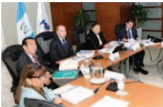
Fiscal General y Jefa del MP, Dra. María Consuelo Porrás Argueta, agradeció a la Organización Internacional Italo Latinoamericana – IILA por el apoyo otorgado para el desarrollo de las acciones y productos de las mesas de Justicia Penal Juvenil