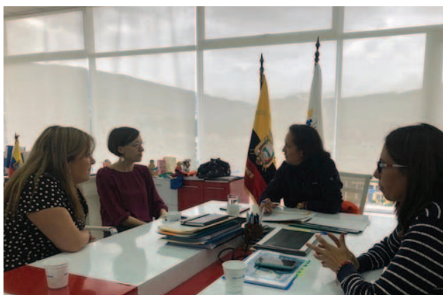
Riunione con la ministra Cordero Molina e la viceministra Soledad Vela nell'Ministerio de Inclusión Económica y social dell'Ecuador

Durante la missione l'esperta si è anche riunita con la Secretaría del Plan Toda una Vida, ente coordinatore degli interventi in materia di politiche sociali, dall'infanzia alla vecchiaia, che avrà un ruolo centrale nel fomentare la coordinazione tra i ministeri della salute, del lavoro, dell'educazione e dello stesso Ministero di Inclusione Economica e Sociale.