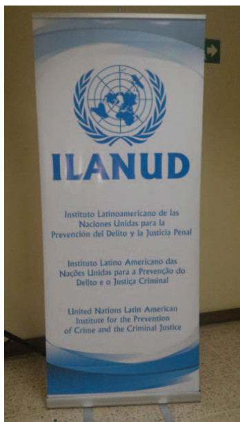
Riunione ILANUD Missione Costa Rica dal 28 gennaio al 1 febbraio 2019