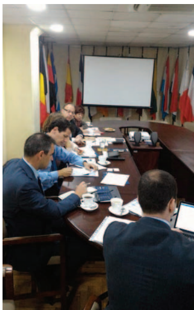
Riunione alla delegazione UE- Missione in Costa Rica dal 28 gennaio al 1 febbraio 2019