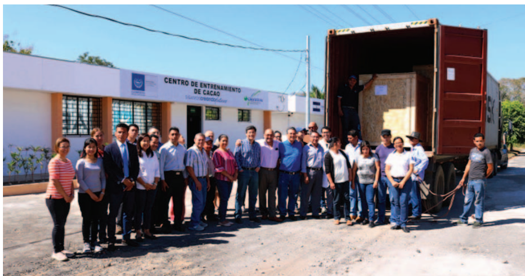
Alcuni momenti della consegna dei macchinari per l'impianto di lavorazione del cacao e del cioccolato

Caraibi, realizzato dall'organizzazione internazionale italo-latinoamericana IILA con fondi dell'Agenzia italiana per la cooperazione allo sviluppo. Il macchinario prevede un'intera linea di lavorazione con le più moderne apparecchiature tecnologiche con una capacità di 30 chilogrammi all'ora, che consentirà ai piccoli produttori di cacao di ottenere una varietà di prodotti derivati da cacao di buona qualità. Il progetto prevede anche una formazione con esperti di cioccolato italiani che terranno corsi nei prossimi mesi. [Autore: Percy Coordinatore Tecnico Locale del progetto IILA]