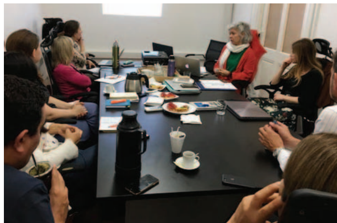
Riunione di chiusura dell'esperta con autorità di SNC, MEC, MTSS, INEFOP, UTU ed altre istituzioni del SNIC.

Al termine della settimana, si è svolta una riunione di chiusura dell'esperta con autorità della Secretaría de Cuidados, del Ministerio d'Istruzione, del Ministerio del Lavoro e della Previdenza Social, dell'Istituto Nazionale dell'Impiego e della Formazione Professionale - INEFOP, dell'"Universidad del Trabajo del Uruguay" – UTU e di altre istituzioni del Sistema Nazionale, e si è espresso l'impegno di continuare a lavorare, in modo sinergico e coordinato, verso la costruzione di paradigmi, visioni ed identità comuni nell'ambito del "cuidado" alle persone non autosufficienti nel corso dell'intero ciclo di vita.