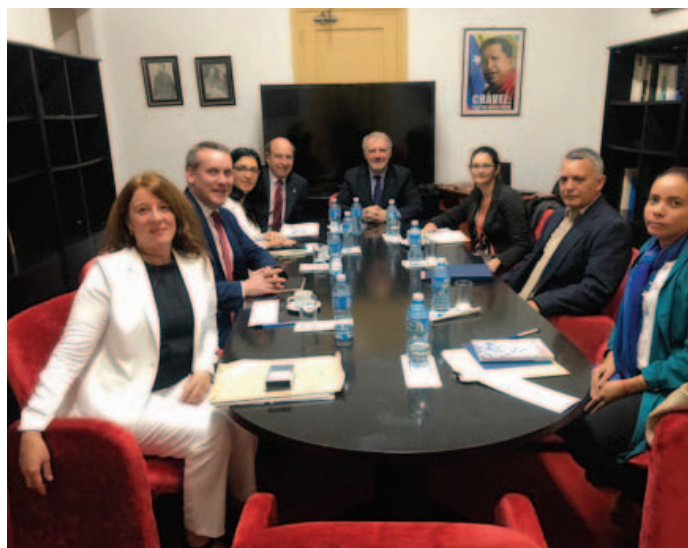
Cuba, Identificazione delle domande Paese, 28 gennaio 1 febbraio 2019 – segue

Va sottolineato che la delegazione ha visitato l'istituto penitenziario "Combinado del Este", la prigione più grande di Cuba, in cui vige un sistema di visite regimentato ed i cui reclusi sono soprattutto condannati per reati contro il patrimonio. Il carcere è dedicato ai detenuti con pene di più di 20 anni di reclusione, e include una sezione per i detenuti più pericolosi.