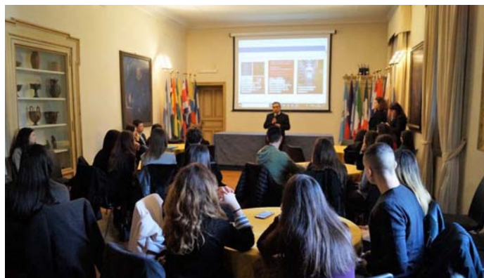
Gli studenti del Liceo "Machiavelli" di Roma incontrano l'Ambasciata del Costa Rica nell'ambito del progetto "Diplomacy Education"