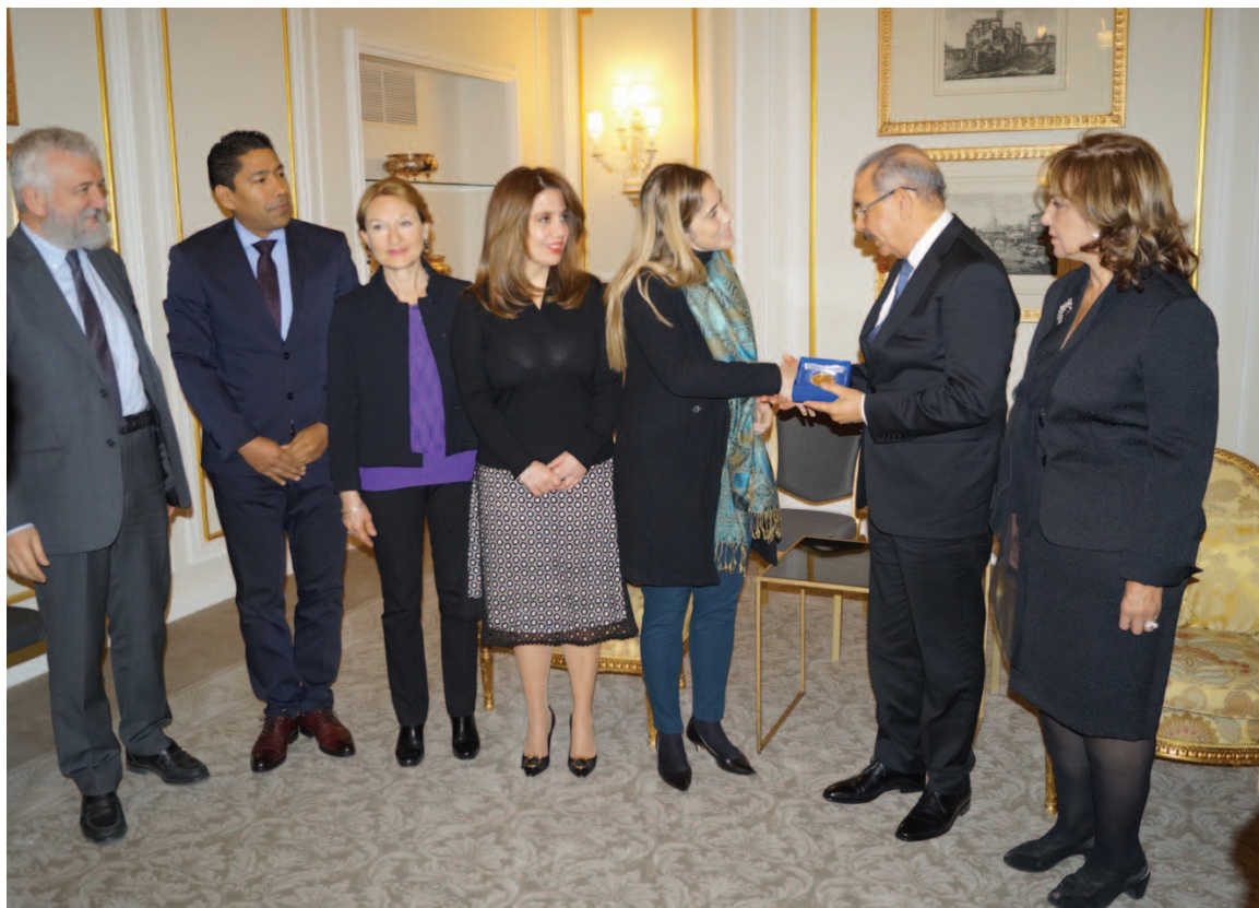
La Presidente a.i. dell'IILA consigna l'omaggio italo-latinoamericano al Presidente della Repubblica Dominicana