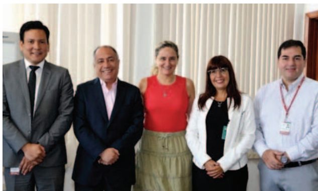
Alcuni momenti dell'assistenza tecnica

L'assistenza tecnica completa il processo iniziato con la visita in Colombia realizzata a metà del 2018, insieme ad una delegazione del Ministero del lavoro del Messico, per conoscere le esperienze dei Ministeri del lavoro, del commercio, della Camera di Commercio e di altre organizzazioni, nonché i servizi Integrati - CAE, della Colombia.