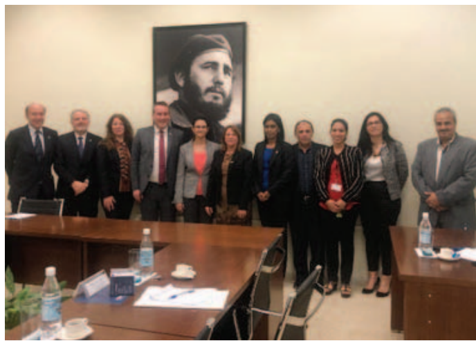
Cuba, Identificazione delle domande Paese, 28 gennaio 1 febbraio 2019 – segue

La richiesta ed apertura delle autorità cubane Per EL PACCTO ha rappresentato un'assoluta novità.